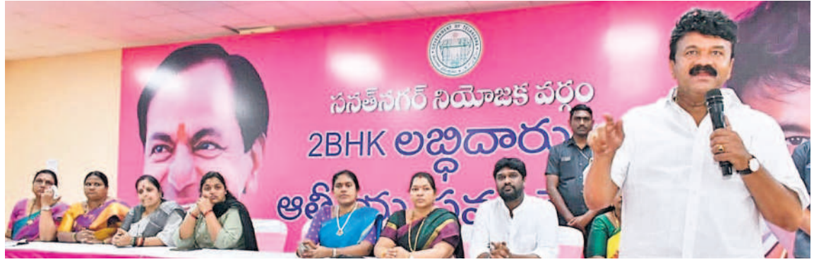
అక్షయ సమావేశంలో మాట్లాడుతున్న మంత్రి తలసాని శ్రీనివాసయ్యాదవ్