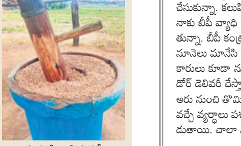
గానుగలో పోసిన పల్లిలు

ఉదయం లేచింది మొదలు.. రాత్రి పడుకునేదాకా అరచేతిలో సెల్ ఫోన్ పట్టుకొని సామాజిక మాధ్యమాల్లో ప్రవచనాన్ని విస్తీర్ణిస్తూ రోజులివి.. అయినా ఓ వృద్ధుడు నాటి తరం ఫీమస్ అయిన రేడియోనే ఇప్పటికీ వాడుతూ 'జెరా' అని పిలుస్తూన్నాడు. పొద్దున నుంచి రాత్రి వరకు దానితోనే కాలక్షేపం చేస్తుంటాడు. దాదాపు 60 ఏండ్లుగా రేడియోనే అట్టిపెట్టు కొని తిరుగు ఊరిలో 'రేడియో తాత' గా పేరు పొందాడు.