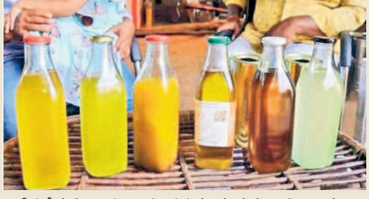
బాటిళ్లలో నువ్వులు, పల్లి, విప్ప, కుసుమ, నల్లనువ్వుల, కొబ్బరి నూనెలు