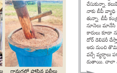
గానుగలో పోసిన పల్లిలు