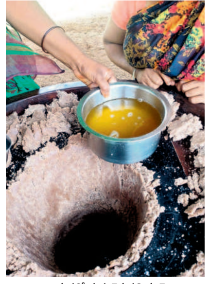
గానుగలో తయారైన పల్లి నూనె