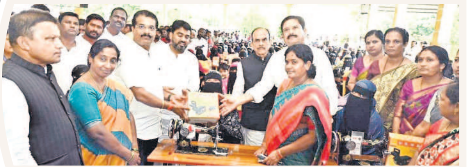
మహిళలకు కుటుంబిషన్లు పంపిణీ చేస్తున్న మంత్రి మహమూద్ అలీ, చిత్రంలో ఎంపీ మన్నె, ఎమ్మెల్యే రాజేందర్ రెడ్డి