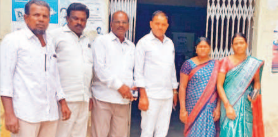
ఎంపీటీసీ కార్యాలయం ఎదుట నిరసన వ్యక్తం చేస్తున్న ఎంపీటీసీలు