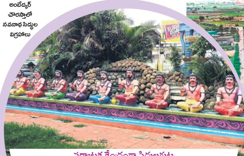
ఆర్మర్ నవనాథ సిద్ధుల గుట్ట