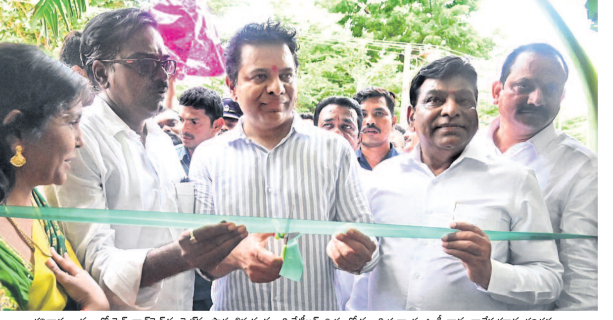
శనివారం ఖమ్మంలో వెజ్, నాన్‌వెజ్ మార్కెట్‌ను ప్రారంభిస్తున్న మంత్రి కేటీఆర్. బిల్డర్లలో మంత్రి పువ్వాడ, ఎమ్మీ నామానాగేశ్వరరావు తదితరులు

ఇది పాలిటికల్ ఎలక్షన్ ట్యాక్స్ కర్ణాటకలో కొత్తగా ఎన్నికైన కాంగ్రెస్ ప్రభుత్వం అవినీతికి తెరలేపింది. తెలంగాణలో జరిగే ఎన్నికల్లో నిధుల సమీకరణకు బెంగళూరు బిల్లర్లకు పాలిటికల్ ఎలక్షన్ ట్యాక్స్‌ను ప్రతి చదరపు అడుగుకు రూ.500 చొప్పున పన్ను విధిస్తున్నది. గ్రాండ్ ఓల్డ్ పార్టీ కాంగ్రెస్.. స్వాముల వారసత్వంతో స్వాగ్రహంగా మారిపోయింది. కర్ణాటక నిధులను తీసుకోవ్వ తెలంగాణలో ఎంత వెదజల్లినా ఇక్కడ ప్రజలను మోసం చేయలేరు. తెలంగాణ ప్రజలు స్వాగ్రహించే తీరుగా ఉండాలి. -మంత్రి కేటీఆర్