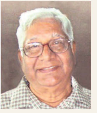
నేడు చేకూరి రామారావు జయంతి

తెలుగు సాహిత్య ప్రపంచంలో విమర్శకులు, భాషా శాస్త్రవేత్తగా పేరుగాంచిన మేధావి చేకూరి రామారావు. 'చేరా'గా అందరికీ సుపరిచితులైన ఆయన తెలుగు వాక్యాన్ని విశ్లేషించడంలో కొత్త ఒరవడికి శ్రీకారం చుట్టారు. కొత్త విమర్శ దోరణిని ప్రవేశపెట్టారు.