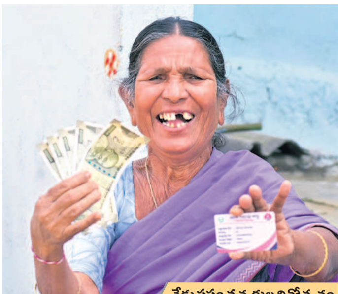
నేడు ప్రపంచ వృద్ధుల దినోత్సవం

వృద్ధాప్యాన్ని రెండో బాల్బల అంటారు. పెద్దవారిని కూడా చిన్నపిల్లల మాదిరిగానే చూసుకోవాల్సి ఉంటుంది. ఆహారం, ఆరోగ్యంతో పాటు అన్నింటికీనూ జాగ్రత్తలు తీసుకోవాల్సి ఉంటుంది. ఉమ్మడి కుటుంబాలు కనుమరుగువుతుండటం, ఉపాధి కోసం సంతానం దూర ప్రాంతాలకు వెళ్తుండటంతో అవసరం దశలో వారికి కష్టాలు ఎదురవుతున్నాయి. వారి సమస్యలను వివరిస్తూ ఎంతో సాహిత్యం వస్తున్నది. ఇవన్నీ సమాజంలోని వాస్తవాలకు అద్దం పడుతున్నాయి. వీరి విగా వృద్ధాశ్రమాలను ఏర్పాటుచేయాలన్న డిమాండ్లు వస్తున్నాయి. స్వచ్ఛంద సంస్థలు, ప్రైవేట్ రంగంలో ఏర్పాటుయ్యే వృద్ధాశ్రమాల సంగతి సరే సరి. ఈ నేపథ్యంలోనే వృద్ధుల సమస్యలు ప్రత్యేకమైనవని, వాటిని పట్టించుకోవాల్సిన బాధ్యత ప్రభుత్వాలపై ఉన్నదన్న భావనలు నెలకొన్నాయి.