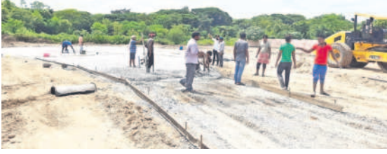
మండమర్రెలో తుదిమెరుగులు దిద్దుకుంటున్న హెలిప్యాక్