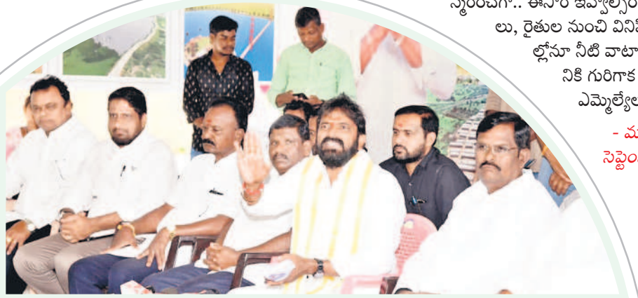
మహబూబ్ నగర్ క్యాంప్ కార్యాలయంలో విలేకరులతో మాట్లాడుతున్న మంత్రి శ్రీనివాస్ గౌడ్

- మహబూబ్ నగర్, సెప్టెంబర్ 30 (నమస్తే తెలంగాణ ప్రతినిధి)