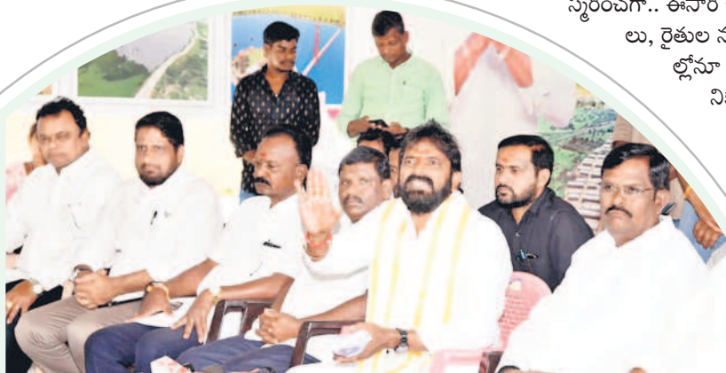
మహబూబ్ నగర్ క్యాంప్ కార్యాలయంలో విలేకరులతో మాట్లాడుతున్న మంత్రి శ్రీనివాస్ గౌడ్

- మహబూబ్ నగర్, సెప్టెంబర్ 30 (నమస్తే తెలంగాణ ప్రతినిధి)