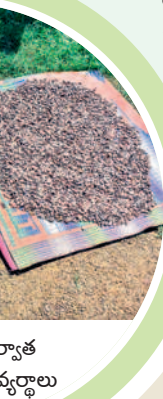
నూనె తీసిన తర్వాత బయటికి వచ్చిన వ్యర్థాలు