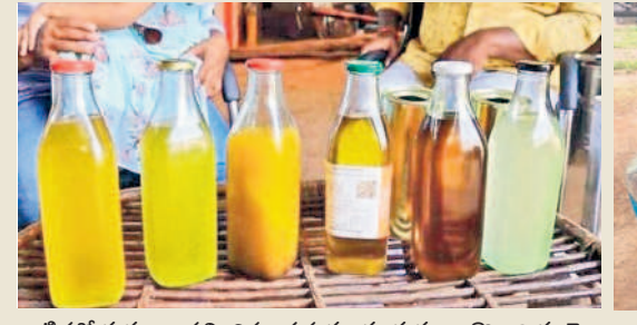
బాటిల్లలో నువ్వులు, పల్లి, విప్ప, కుసుమ, నల్లనువ్వులు, కొబ్బరి నూనెలు