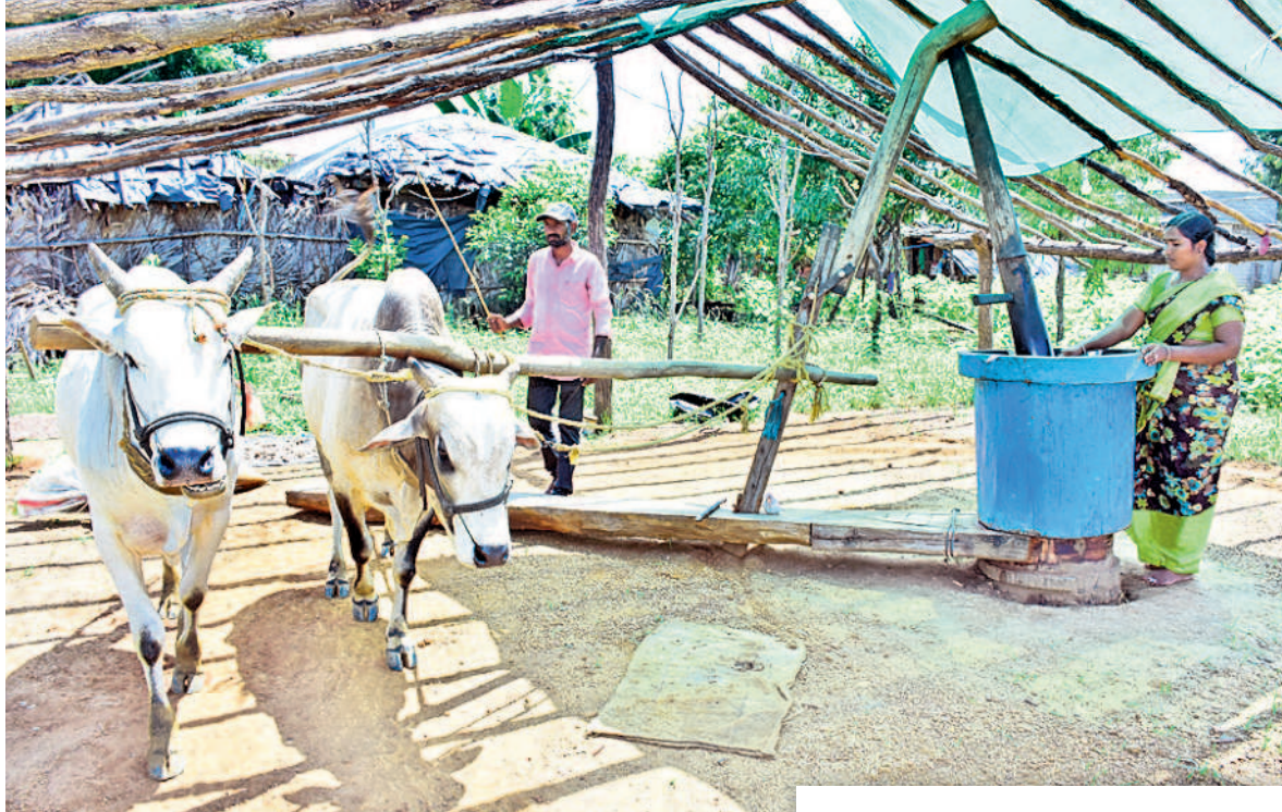
గానుగ పరికరంలో ఎద్దుల ద్వారా నూనె తయారు చేస్తున్న రాజు దంపతులు

- జయశంకర్ భూపాలపల్లి, సెప్టెంబర్ 30 (నమస్తే తెలంగాణ)