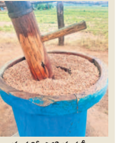
గానుగలో పోసిన పల్లిలు

గానుగ నూనె తయారీపై రాజు ప్రత్యేక శిక్షణ పొందాడు. మహబూబాబాద్ గర్ జిల్లా జిక్సపల్లి గ్రామంలో 15రోజుల పాటు గానుగ నూనె తయారీ, యూనిట్ పై ఏయే నూనెలు తయారు చేస్తారు, గానుగ యంత్రం (కరెంట్ మిషన్) తో చేసే నూనెలు, ఎద్దు గానుగ యూనిట్ తో చేసే నూనెలకు తేడా.. ఎద్దుగానుగ నూనెలో పోషకాలు, నూనెల మార్కెటింగ్ తదితర అంశాలపై పూర్తిస్థాయిలో శిక్షణ తీసుకున్నాడు. ఆ తర్వాత తన గ్రామంలో ఎద్దు గానుగ యూనిట్ నెలకొల్పాడు. ఆర్థిక స్తోమత లేక సుమారు 8 లక్షల వరకు అప్పు తెచ్చాడు. బిత్తూరుకు చెందిన కోవండవారి ని తీసుకువచ్చి చెక్క గానుగ పరికరాన్ని తయారు చేయించాడు. వరంగల్, కర్ణాటక, జమీరాబాద్ లనుంచి నూనెలకు కావాల్సిన ముడిపదార్థం (రసాయన రహిత) తెచ్చి గానుగ నూనె తయారీని ఏడాది క్రితం ప్రారంభించాడు