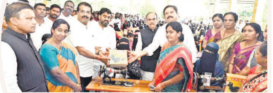
మహిళలకు కుటుంబిషన్లు పంపిణీ చేస్తున్న మంత్రి మహమూద్ అలీ, చిత్రంలో ఎంపీ మన్నె, ఎమ్మెల్యే రాజేందర్ రెడ్డి