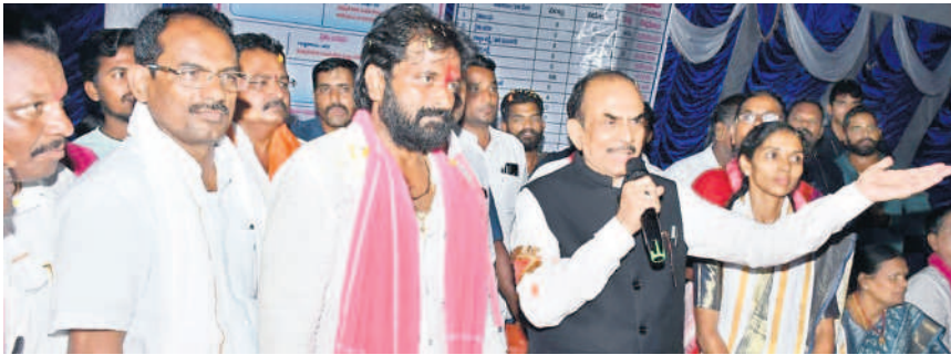
సమావేశంలో మాట్లాడుతున్న హోంశాఖ మంత్రి మహమూద్ అలీ, చిత్తంలో మంత్రి శ్రీనివాస్ గౌడ్

మహబూబ్ నగర్, సెప్టెంబర్ 30 : "పాలమూరు ప్రజలు చూపారంజించు.. వలసలు మాని పది మందికి పని కల్పించే స్థితికి చేరుకున్నాం. సీఎం మోదీ తెలంగాణకు ఎలాంటి మేలు చేకూర్చకుండా కేవలం రాజకీయ లబ్ధి కోసం సభలు, సమావేశాలు పెడుతున్నారు. పాలమూరు కరువు తీరేలా ప్రాజెక్టును కట్టుకుంటుంటే జాతీయ హోదా ఇవ్వకుండా ఏ మొఖం పెట్టుకొని సీఎం పాలమూరుకు వస్తున్నారని ఎక్సైజ్ శాఖ మంత్రి శ్రీనివాస్ గౌడ్ మండిపడ్డారు. శుక్రవారం జిల్లా కేంద్రంలోని క్యాంప్ కార్యాలయంలో విలేజరులతో మంత్రి మాట్లాడారు. మోదీ మహబూబ్ నగర్ కు ఇప్పటివరకు మూడున్నాడు వచ్చి పెట్టిన చోటే మళ్లీ సభలు పెడుతూ ప్రజలకు ఏం మేలు చేకూర్చారని ప్రశ్నించారు. ఏవో రెండు మాటలు చెప్పి ప్రచారం చేసి వెళ్తున్నారు తప్ప.. మహబూబ్ నగర్ కు ఎలాంటి ఉపయోగం లేదని దుయ్యబట్టారు. కరివెన, ఉండూరు, ఐటీ టవర్, కేసీఆర్ ఎకో అర్బన్ పార్కుతోపాటు 2వ తేదీన 26వేల ఎకరాలలో జంగల్ సఫారీ ప్రారంభించి ప్రపంచ నలుమూలల నుంచి పాలమూరును చూసి వెళ్తూ తీర్చిదిద్దుతున్నామని స్పష్టం చేశారు. మన్యోగండ్ ఆలయ అభివృద్ధి కోసం నివేదికలు పంపిస్తే ఒక్క రూపాయి కూడా ఇవ్వకుండా తిప్పి పంపిన విషయాన్ని పాలమూరు ప్రజలు మర్చిపోలేదని గుర్తు చేశారు. మోదీ వచ్చినా, ఎంతమంది జేజమ్మలొచ్చినా ఏమీ చేయలేరని, ప్రజల సంక్షేమం కోసం తమ