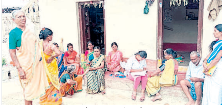
జామ్ గ్రామంలో ప్రజలకు వైద్య పరీక్షలు చేస్తున్న సిబ్బంది