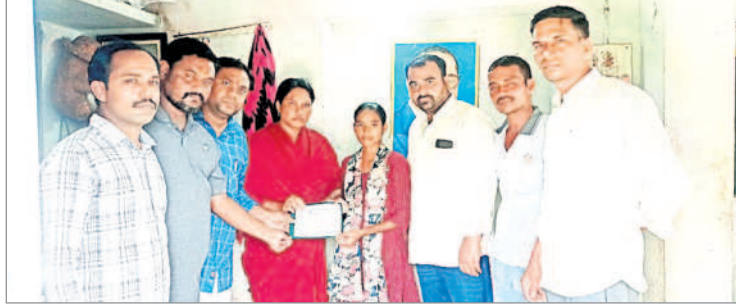
బాధిత కుటుంబానికి ఆర్థిక సాయం అందజేస్తున్న మిత్రులు

లక్ష్మణచాంద, సెప్టెంబర్ 30 : మండలంలోని వడ్డూర్ ఉన్నత పాఠశాలలో 1999-2000 సంవత్సరంలో పదోతరగతి చదివిన ఎన్ జనార్దన్ ఇటీవల అనారోగ్యంతో మృతిచెందాడు. సమాచారం తెలుసుకున్న అతడి బాల్య మిత్రులు