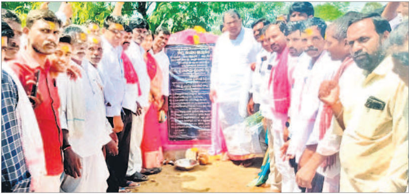
సుంకినిలో కుర్చు సంఘ భవన నిర్మాణానికి శంకుస్థాపన చేస్తున్న స్వీకర్ పోచారం

అన్నారు. 24 గంటల విద్యుత్ సరఫరా చేస్తామని చెప్పినేడు బెంగళూరు నగరానికి కరోట్ ఇవ్వడంలేదన్నారు. మహిళలకు ఉచిత ప్రయాణం కల్పిస్తామన్న కాంగ్రెస్.. డీజిల్ లేక బస్సులు కూడా నడపడంలేదన్నారు. ప్రజలకు బియ్యం లేక అక్కడి సీఎం.. మన కేసీఆర్ కు ఫోన్ చేసి బియ్యం కావాలని అడుతున్నారని గుర్తుచేశారు. అక్కడి హామీలకే దిక్కులేదాగానీ, మళ్ళీ తెలంగాణలో 6 గ్యారంటీల పేరిట మోసం చేసేందుకు కాంగ్రెస్ నాయకులు ప్రయత్నిస్తున్నారని ఆగ్రహం వ్యక్తం చేశారు. గతంలో ఇందిరమ్మ ఇండ్ల పేరిట పెద్దపత్తున కుంభకోణం జరిగిందని, ఇండ్లు కట్టకుండానే కోట్ల రూపాయలు బిల్లలను