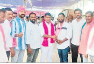
గోదామును ప్రారంభిస్తున్న ఎమ్మెల్యే జీవన్ రెడ్డి