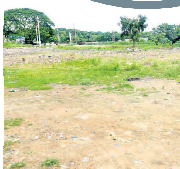
గోదావరిపట్లలోని రామగుండం కార్పొరేషన్ కార్యాలయం వెనుక నిర్మించనున్న ఐటీ టవర్ స్థలం ఇదే