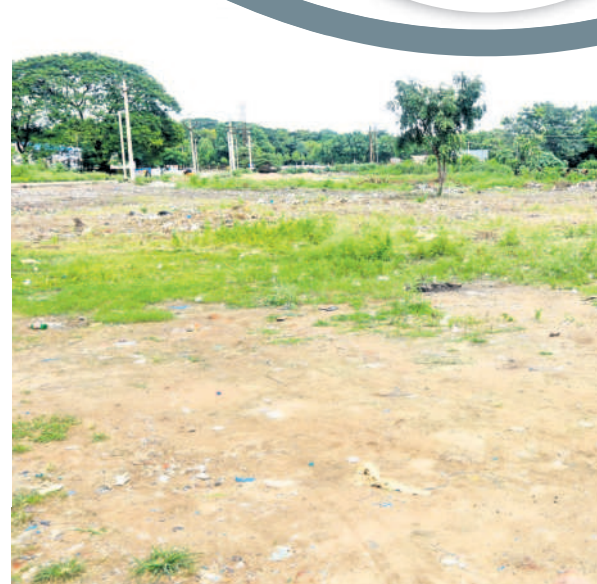
పోలీస్ కమిషనరేట్ కార్యాలయం