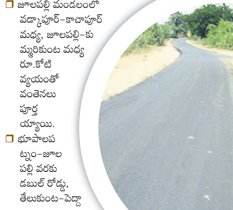
బి.దెల: పెగడపల్లి-ఓదెల మధ్య బీటీ రోడ్డు