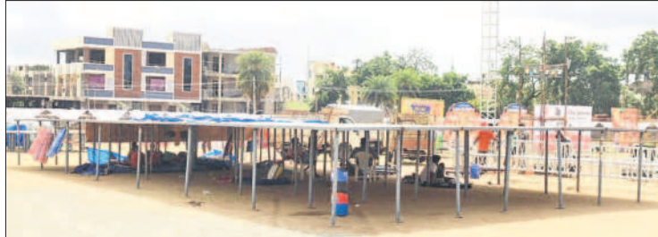
పెద్దపల్లి ప్రభుత్వ జూనియర్ కళాశాల మైదానంలో ప్రగతి నివేదన సభకు సిద్ధమవుతున్న వేదిక

ర్గాంలో ఇండస్ట్రియల్ పార్క్ నిర్మాణ పనులకు సంబంధించి అక్కడే ఏర్పాటు చేసిన శిలాఫలకాలకు శంకుస్థాపన చేస్తారు. అనంతరం ₹100 కోట్ల టీఎంఎఫ్ ఐడీసీ నిధులతో చేపట్టే అభివృద్ధి పనుల పైలాన్తోపాటు పలు అభివృద్ధి పనులకు శంకుస్థాపన చేయనున్నారు. ఖురూజ్ కమ్మి భూములకు సంబంధించి 600 మంది పెద్దం పేట్, రాయడండి ప్రజలకు హక్కు పత్రాలు అందిస్తారు. జీవో 76 ద్వారా సింగరేణి స్టలాలో అనేక ఏండ్లుగా జీవిస్తున్న కుటుంబాలకు, 58, 59 జీవో ద్వారా మున్సిపల్ కార్పొరేషన్, రెవెన్యూ స్టలాలో అనేక ఏండ్లుగా నివాసముంటున్న వారికి ఇంటి పట్టాలు అందిస్తారు. అలాగే, గృహలక్ష్మి లబ్ధిదారులకు ప్రాసీడింగ్స్, 3425 మందికి ₹4వేల చొప్పున ఆసరా పింఛన్లు పంపిణీ చేస్తారు. ఆ