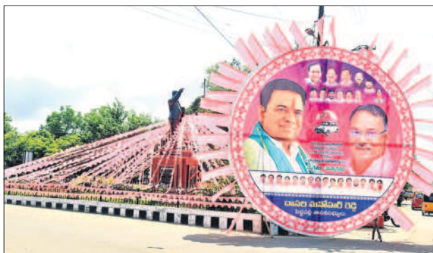
పెద్దపల్లి చౌరస్తాలో మంత్రి కేటీఆర్ కు స్వాగతం పలుకుతూ వెలిసిన ఫ్లెక్సీ