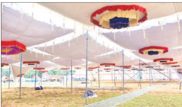
గోదావరిఖని స్టేడియంలో జరిగే దశాబ్ది ప్రగతి సభ కోసం వేసిన షామియానాలు