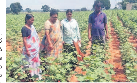
కేశంపేటలో పత్తి పంటను పరిశీలిస్తున్న డీఎస్ గీతారెడ్డి

కేశంపేట, సెప్టెంబర్ 30 : పత్తి, మొక్కజొన్న పంటల్లో తెగుళ్ల నివారణకు రైతులు వ్యవసాయ శాఖ అధికారుల సూచనల మేరకు సస్యరక్షణ చర్యలు చేపట్టాలని వ్యవసాయ శాఖ జిల్లా అధికారిణి గీతారెడ్డి సూచించారు. కేశంపేట మండల కేంద్రంలోని పలువురి రైతుల పత్తి, మొక్కజొన్న పంటలను ఆమె పరిశీలించారు. పంటలకు పలు రకాల తెగుళ్లు వస్తున్నాయని తెలిపారు. వాటి నివారణకు వ్యవసాయ