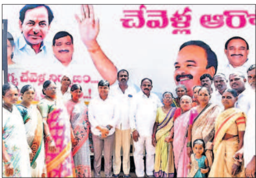
ఆరోగ్య రథ సేవలను ప్రారంభిస్తున్న ఎమ్మెల్యే యాదయ్య