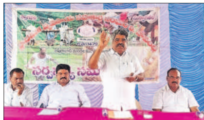
బషీరాబాద్ : సమావేశంలో మాట్లాడుతున్న సీకావో