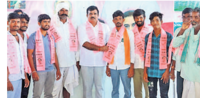
అందోల్: ఎమ్మెల్యే క్రాంతి కిరణ్ సమక్షంలో బీఆర్ఎస్లో చేరుతున్న రేగోడ్ మండల నాయకులు

అందోల్, సెప్టెంబర్ 30: తెలంగాణ ప్రభుత్వం చేపడుతున్న అభివృద్ధి, సంక్షేమ పథకాలను చూసి కాంగ్రెస్, బీజేపీల నుంచి బీఆర్ఎస్లో చేరుతున్నారని ఎమ్మెల్యే చంటి క్రాంతి కిరణ్ అన్నారు. శనివారం వట్లపల్లి మండలం పోతులబొగడలోని ఎమ్మెల్యే నివాసంలో రేగోడ్ మండలం సంగమేశ్వర్ తండాకు చెందిన వార్డు సభ్యుడు తులూనాయక్తోపాటు కాంగ్రెస్ కార్యకర్తలు, మర్చల్లికి చెందిన కాంగ్రెస్ నాయకులు బీఆర్ఎస్లో చేరారు. ఎమ్మెల్యే వారికి కండువాల కప్పి పార్టీలోకి ఆహ్వానించారు.