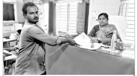
తహసీల్దార్ కు జరిమానా రసీదు అందజేస్తున్న నిందితుడు