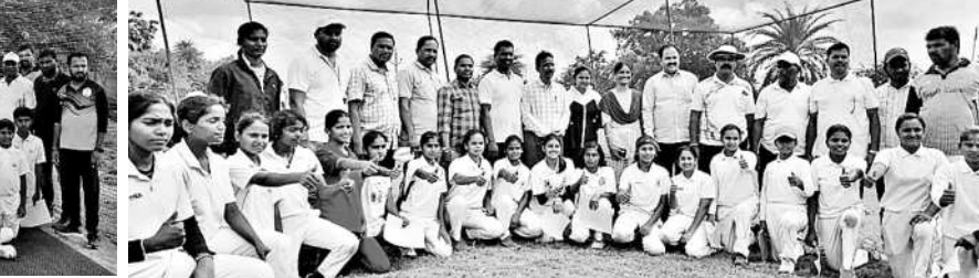
రాష్ట్రస్థాయి క్రీకెట్ పోటీలకు ఎంపికైన ఉమ్మడి జిల్లా బాలుర, బాలికల జట్లు