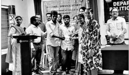
విజేతలకు బహుమతులను అందజేస్తున్న తారా కళాశాల ప్రిన్సిపాల్, అధ్యక్షక బృందం

సంగారెడ్డి కలెక్టరేట్/ పటాన్చెరు, సెప్టెంబర్ 30 : జిల్లా స్కూల్ గేమ్స్ ఫెడరేషన్ ఇండియా ఆధ్వర్యంలో శనివారం పటాన్చెరు పట్టణంలో నిర్వహించిన ఉమ్మడి మెడక్ జిల్లా స్థాయి క్రీకెట్ పోటీలకు 200 మంది క్రీడాకారులు హాజర