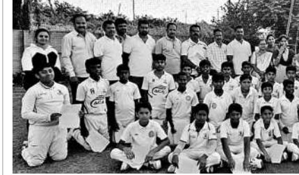
రాష్ట్రస్థాయి క్రీకెట్ పోటీలకు ఎంపికైన ఉమ్మడి జిల్లా బాలుర, బాలికల జట్లు