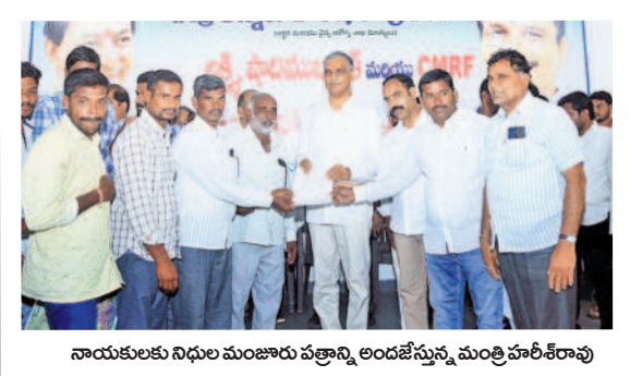
నాయకులకు నిధుల మంజూరు పత్రాలు అందజేస్తున్న మంత్రి హరీశ్ రావు

స్థలాల మంజూరు పత్రాలని పంపిణీ చేసిన మంత్రి హరీశ్ రావు సిద్దిపేట పట్టణంలో రజక సంఘం ఫంక్షన్ హాల్ కు 12 గుంటల స్థలం, ముస్లిం శృశాన వాటిక నిర్మాణానికి 4 ఎకరాలు, వాలిబాల్ ఆకాడమీ నిర్మాణానికి 1.20 ఎకరం, హిందూ శృశాన వాటిక నిర్మాణానికి 1.20 ఎకరం, ఎల్లు పల్లి గ్రామంలో గౌడ సంఘం ఈత చెట్లు నాటేందుకు ఎకరం స్థలాన్ని మం జూరు చేసినట్లు మంత్రి చెప్పారు. ఈ సందర్భంగా పలు సంఘాల ప్రతినిధులకు మంజూరు పత్రాలను అందజేశారు. ఈ సందర్భంగా మంత్రి హరీశ్ రావుకు వారు కృతజ్ఞతలు తెలిపి హర్షం వ్యక్తం చేశారు.