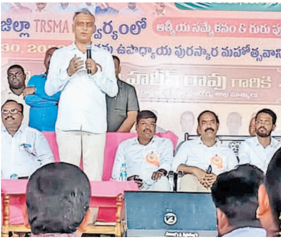
సమావేశంలో మాట్లాడుతున్న మంత్రి హరీశ్ రావు

సిద్దిపేట, సెప్టెంబర్ 30 : సిద్దిపేటకు 3న మధ్యాహ్నం మూడు గంటలకు హైదరాబాద్ నుంచి రైలు ప్రారంభం కాబోతున్నదని మంత్రి తన్నీరు హరీశ్ రావు తెలిపారు. శనివారం సిద్దిపేట కొండ మల్లయ్య గార్డెన్ లో జరిగిన ట్రైన్స్ ఆధ్వర్యంలో ప్రైవేట్ టీవీ అసోసియేషన్ ఆధ్వర్యంలో గురుపూజోత్సవం.. ఆత్మీయ సమ్మేళనంలో మంత్రి పాల్గొని మాట్లాడారు. ప్రైవేట్ పాఠశాలలో పనిచేసే వారు తమ కుటుంబాలకు ఎంతోకొంత ఉపయోగ పడాలనే లక్ష్యంతో పనిచేస్తున్నారు. ఉపాధ్యాయులుగా మీరు సమాజానికి చక్కని సేవలను అందిస్తున్నారు. నేడు విద్యా వ్యవస్థను బలోపేతం చేయడంతో గురుతర బాధ్యతను పోషిస్తున్నారని మంత్రి అన్నారు. ప్రభుత్వ పాఠశాలల్లో ఆంగ్ల మాధ్యమం ప్రారంభం కావడం, ప్రభుత్వం పెద్ద ఎత్తున రెసిడెన్షియల్ పాఠశాలలను ఏర్పాటు చేయడంతో ప్రైవేట్ పాఠశాల నడవడం యాజమాన్యలకు కత్తి మీద సాముల మారినన్నారు. పోటీ పెరిగిందన్నారు. సిద్దిపేట జిల్లా ఏర్పాటు, రైలు తీసుకురావడం, సిద్దిపేటకు గోదావరి జలాలు అనేవి ఎన్నికల ప్రచారంగా ఉండేవన్నారు. కానీ, తెలంగాణ రాష్ట్రం ఏర్పడిన తర్వాత సీఎం కేసీఆర్, సిద్దిపేట ప్రజల ఆశీస్సులతో హామీలు అన్ని నేరవేరాయన్నారు. మహిళా డిగ్రీ కాలేజీతో పాటు ప్రభుత్వ ఐటీఐ, 4 పాలిటెక్నిక్ కాలేజీలు, మెడికల్ కాలేజీ,