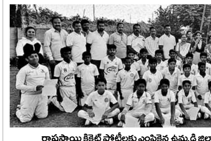
రాష్ట్రస్థాయి క్రీకెట్ పోటీలకు ఎంపికైన ఉమ్మడి జిల్లా బాలుర, బాలికల జట్టు