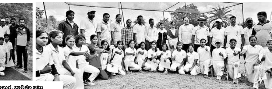
రాష్ట్రస్థాయి క్రీకెట్ పోటీలకు ఎంపికైన ఉమ్మడి జిల్లా బాలుర, బాలికల జట్టు