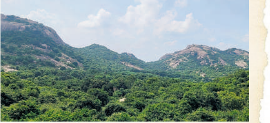
దట్టమైన అడవితో ఉండ్రుగొండ గుట్టలు

ఉమ్మడి రాష్ట్రంలో 2002 సంవత్సరంలోనే ఇది వెలుగులోకి వచ్చినప్పటికీ అప్పటి పాలకులు పట్టణంకోసం పడకతో ఏ మాత్రమూ అభివృద్ధి జరుగలేదు. స్వరాష్ట్రంలో ప్రతి సంవత్సరం బ్రహ్మాత్మవారు నిర్వహించడంతోపాటు నిత్య పూజలు జరుగుతున్నాయి. అలయం వద్దకు వెళ్లేందుకు ఘాట్ రోడ్డు నిర్మాణం పూర్తయింది. భక్తుల కోసం ప్రజా మరుగుదొడ్డును నిర్మించారు. అలయం వద్ద మినీ ఫంక్షన్ హాల్, ఆలయం ఎదురు ఉన్న కోనేరుకు మెట్లు ఏర్పాటు చేశారు.