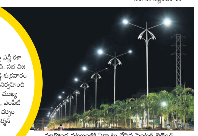
నల్లగొండ పట్టణంలో ఏర్పాటు చేసిన సెంట్రల్ లైటింగ్