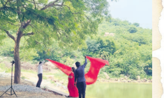
వీడియో షూటింగ్ దృశ్యం (ఫైల్)

అలయం ముందున్న కోనేరులో గజేంద్ర మోక్షం తలపించు కరి-మకరుల ఆకృతులు, అలయం వెనుక భాగాన ఆదిశివ అవతారం, కోనేరు ఒడ్డున కూర్చున్నారం, ఆలయానికి వచ్చే దారిలో ఎస్పారెస్సో కార్నాల్ (జాతీయ రహదారి 65) దగ్గర నుంచి చూస్తే హిరణ్యకశిపుని సంహారం తర్వాత విశ్రాంతి తీసుకుంటున్నట్లుగా ఉన్న శయన సరసించాస్వామి, సహజ శిల్పాకృతులు ఉన్నాయి. గూఢాలు, అంజనేయస్వామి, కాలభైరవ విగ్రహాలు, కోట గోడలు, గుట్ట వైసుంచి దేవాలయం వెనుక భాగం ఆనుకుంటూ, కోనేర్లు ఇప్పటికీ నీటితో కళకళ రాడుతున్నాయి. బోగం దాని గద్దె, పంపెం బావి, కేమియాలి కుంటు, నాయినివారి బావి, ఏనుగుల దర్వాజు, పీనుగుల దర్వాజు, నాగులపడక దర్వాజు, మల్లయ్యస్వామి గుడి, రుపల మఠం, పహారా, గోపాలస్వామి గుడి, గుట్ట చుట్టూ 18 అంజనేయస్వామి విగ్రహాలు రామాలయ స్థలం, శంఖం, చక్రం, మూల దర్వాజు, జాలు దర్వాజులు ఉన్నాయి. భారతదేశంలో ఏ గుట్టపైనా లేని విధంగా ఇక్కడ గుట్ట పైన నీరు నిల్వ ఉండడం ఉండ్రుగొండకున్న ప్రత్యేకత. ఎన్నో విశిష్టతలు కలిగిన ఈ గుట్ట 2002లో వెలుగులోకి వచ్చింది.