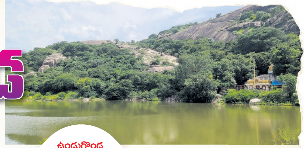
అలయం ముందు ఉన్న అందమైన కోనేరు

ఎత్తైన నల్లని కొండలు.. విస్తారంగా పరుచుకున్న పచ్చని దట్టమైన అడవి, బలిపట్టణం దుర్గా ప్రాకారాలు, ఈత కొలనులు.. చాలి క్రక కట్టడాలు, పాడవైన కోట గోడలు, రమణీయ వాతావరణంతో ఉండ్రుగొండ గుట్టలు కనువిందు చేస్తున్నాయి. గిరి దుర్గంలో కొలువై ఉన్న లక్ష్మీనర్సింహస్వామి ఆలయం ఆధ్యాత్మిక నిలయంగా పేరొందింది. స్వామి వారిని దర్శించుకున్నవారు ప్రకృతి అందాలను తిలకించకుండా ఇక్కడి నుంచి వెళ్లరు. ప్రకృతి అందాలను తిలకించేందుకు కుటుంబ సభ్యులతో కలిసి, యువకులు, ప్రకృతి ప్రేమికులు, పర్యాటకులు అధికంగా వస్తుంటారు. ఇక్కడ తరచూ ఫాటో షూట్లు, షార్ట్ ఫిల్మ్లు చిత్రీకరణ జరుగుతుంటాయి.