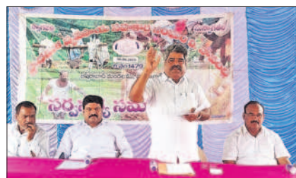
బషీరాబాద్ : సమావేశంలో మాట్లాడుతున్న సీకావో