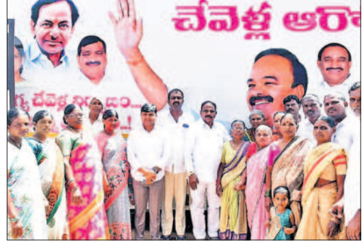
ఆరోగ్య రథ సేవలను ప్రారంభిస్తున్న ఎమ్మెల్యే యాదయ్య