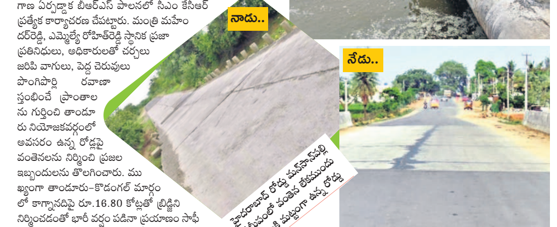
హైదరాబాద్ రోడ్డు మున్సానపల్లి సమీపంలోని నూతనంగా నిర్మించిన కల్వకుర్తి