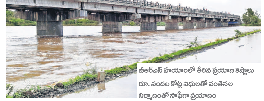
బీఆర్ఎస్ హయాంలో తీరిన ప్రయాణ కవ్వాల రూ. వందల కోట్ల నిధులతో వంతెనల నిర్మాణంతో సాఫీగా ప్రయాణం