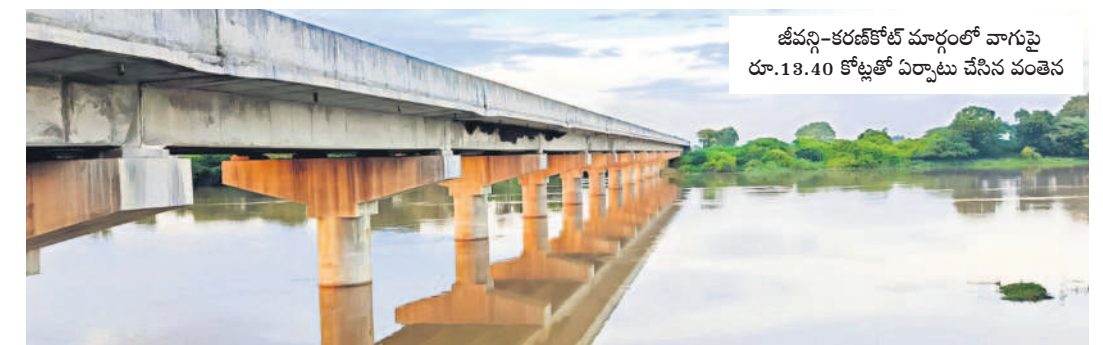
జీవన్-కరణ్ కోట్ల మార్గంలో వాగుపై రూ.13.40 కోట్లతో ఏర్పాటు చేసిన వంతెన

జానకి ప్రభుత్వం ప్రత్యేక నిధులు కేటాయించగా.. త్వరలోనే పనులను ప్రారంభించేందుకు అధికారులు చర్యలు చేపట్టారు. తాండూరు నియోజకవర్గ అభివృద్ధికి నిరంతరం కృషి చేస్తున్న మంత్రి మహేందర్ రెడ్డి, ఎమ్మెల్యే రోహిత్ రెడ్డిని ప్రజలు అభినందిస్తూ మద్దతు తెలుపుతున్నారు.