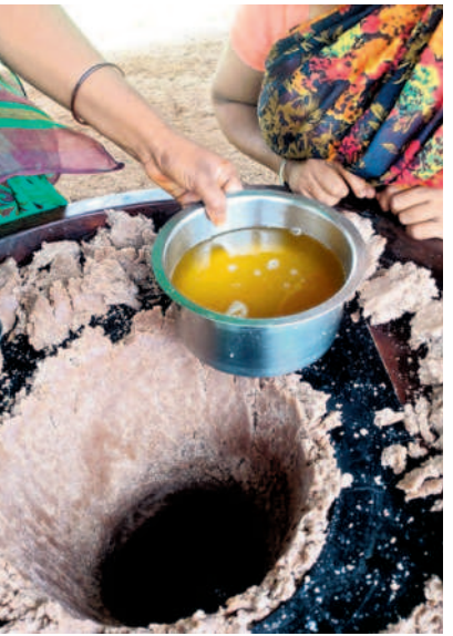
గానుగలో తయారైన పల్లి నూనె