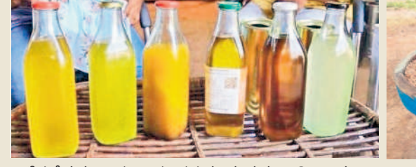
బాటిల్లలో నువ్వులు, పల్లి, విప్పి, కుసుమ, నల్లనువ్వుల, కొబ్బరి నూనెలు