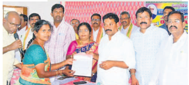
పోచంపల్లిలో చేనేత కుటుంబానికి ఎక్స్ గ్రేషియా చెక్కును అందిస్తున్న ఎమ్మెల్యే పైళ్ల శేఖర్ రెడ్డి