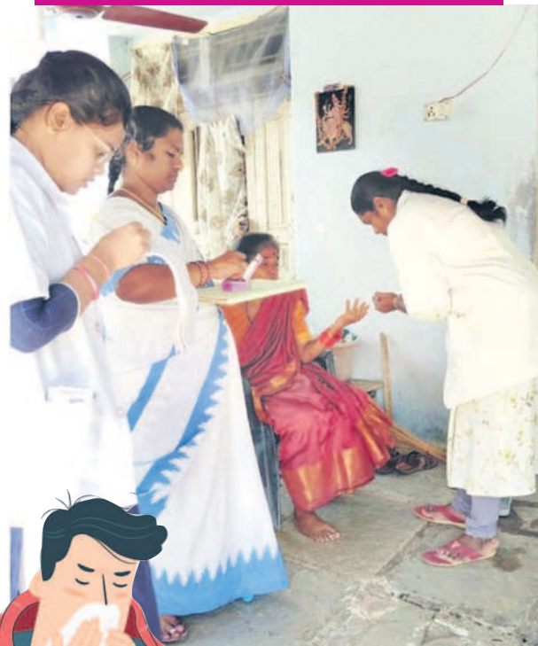
ఆలేరు మండలంలోని శారాజీవితలో జ్వర సర్వే చేస్తున్న ఆరోగ్య సిబ్బంది

వ్యాధులు వ్యాప్తి చెందకుండా యాక్షన్ ప్లాన్ 24 గంటలు అందుబాటులో ఉండేలా కంట్రోల్ రూమ్లు ర్యాపిడ్ రెస్పాన్స్ టీమ్ ఏర్పాటు జిల్లావ్యాప్తంగా ఫీవర్ సర్వే ప్రారంభం ఇంటింటికీ వెళ్లి సర్వే చేస్తున్న ఏఎన్ఎంలు, ఆశ వర్కర్లు ఒక్క కేసును గుర్తించినా చుట్టూ 50 ఇండ్లలో పరీక్షలు ఉచితంగా వ్యాధి నిర్ధారణ పరీక్షలు.. మందులు పాలిశుద్ధ్యంపై ప్రజలకు అవగాహన శాఖల సమన్వయంతో ముందుకు