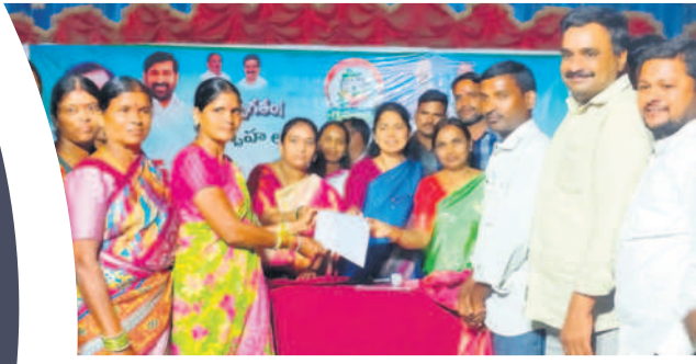
మోటకొండూర్ లో లబ్ధిదారులకు గృహలక్ష్మి ప్రాసీడింగ్స్ అందిస్తున్న ప్రభుత్వ విప్ గొంగిడి సునీతామహేందరరెడ్డి