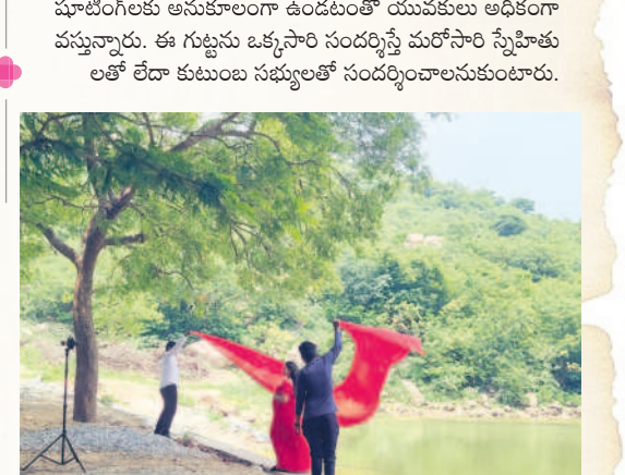
వీడియో షూటింగ్ దృశ్యం (ఫైల్)

ఎంతో ప్రసిద్ధి చెందిన ఉండ్రుగొండ గుట్టల్లో షార్ట్ ఫిల్మ్, ప్రీ వెడ్జింగ్, ఫాటో షూటింగ్ కోసం జిల్లా నలుమూలల నుంచే కాకుండా ఇతర రాష్ట్రాల నుంచి నిత్యం ఇక్కడకు వస్తుంటారు. అక్కడున్న ప్రతి లోకేషన్ అద్భుతంగా ఉండటమే కాకుండా షూటింగ్లకు అనుకూలంగా ఉండటంతో యువకులు అధికంగా వస్తున్నారు. ఈ గుట్టను ఒక్కసారి సందర్శిస్తే మరోసారి స్నేహితులతో లేదా కుటుంబ సభ్యులతో సందర్శించాలనుకుంటారు.