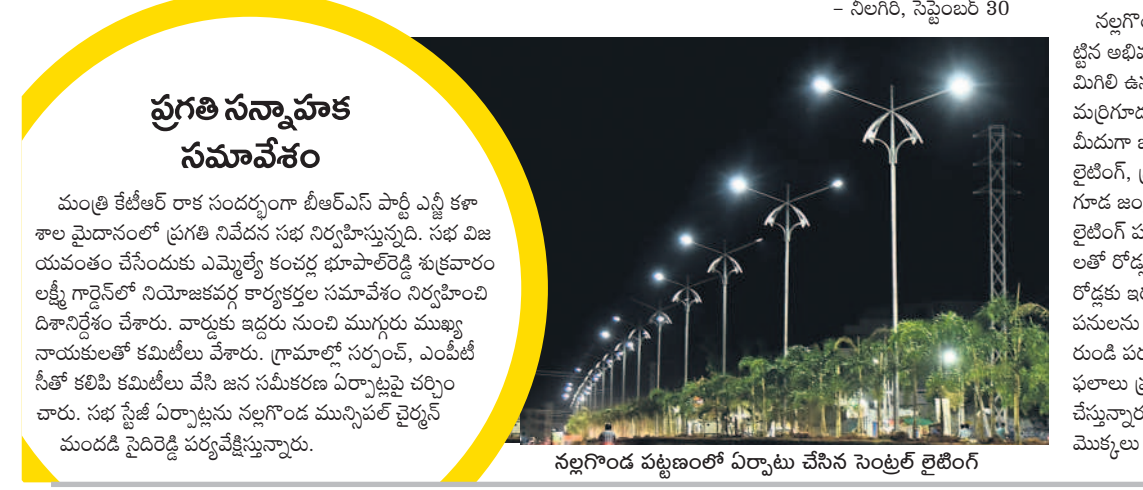
నల్లగొండ పట్టణంలో ఏర్పాటు చేసిన సెంట్రల్ లైటింగ్