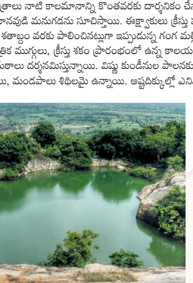
కొండపైన ఉన్న కొలను

అలయం ముందున్న కోనేరులో గజేంద్ర మోక్షం తలపించు కరి-మకరుల ఆకృతులు, అలయం వెనుక భాగాన ఆదిశివ ఆవతారం, కోనేరు ఒడ్డున కూర్చున్నారం, అలయానికి వచ్చే దారిలో ఎస్పారెస్సో కార్నాల్ (జాతీయ రహదారి 65) దగ్గర నుంచి చూస్తే హిరణ్యకశిపుని సంహారం తర్వాత విశ్రాంతి తీసుకుంటున్నట్లుగా ఉన్న శయన సరసించాస్వామి, సహజ శిల్పాకృతులు ఉన్నాయి. గూఢాలు, అంజనేయస్వామి, కాలభైరవ విగ్రహాలు, కోట గోడలు, గుట్ట వైసుంచి దేవాలయం వెనుక భాగం ఆను