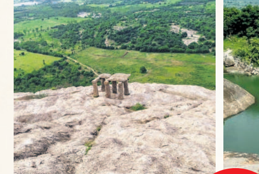
కొండపైన ఉన్న మండపం