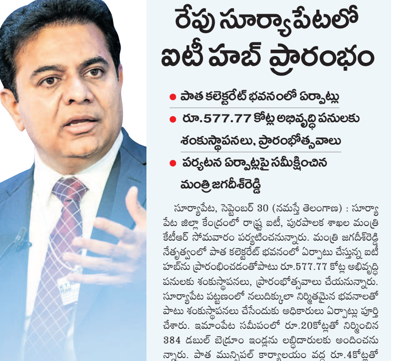
వేగంగా ప్రారంభోత్సవాల కార్యక్రమాలు