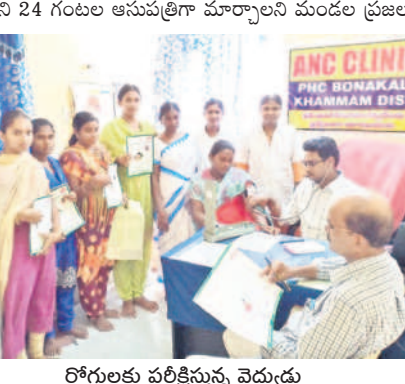
రోగులకు పరీక్షిస్తున్న వైద్యుడు

పీహెచ్సీని 24 గంటల ఆసుపత్రిగా మార్చాలని మండల ప్రజలు కోరుతున్నారు. ప్రస్తుతం ఆసుపత్రి ప్రతిరోజూ ఉదయం 9 నుంచి ఆసుపత్రి పుష్కలంగా ఉన్న మెడిసన్