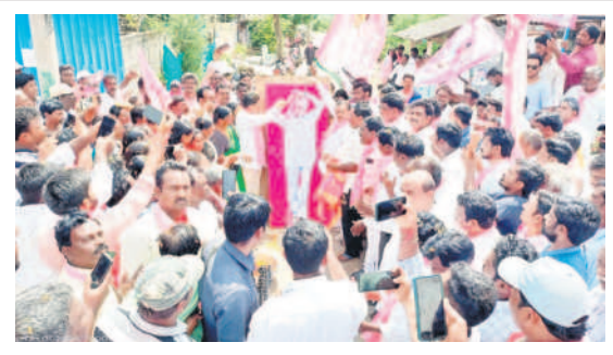
మధుర : సీఎం కేసీఆర్ చిత్రపటానికి క్షీరాభిషేకం చేస్తున్న వైద్యులు