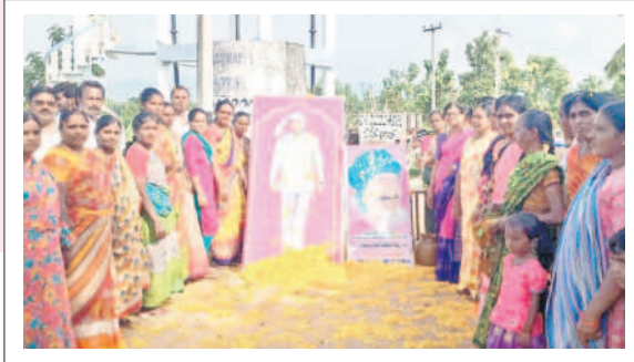
పెనుబల్లి : సీఎం కేసీఆర్ చిత్రపటానికి క్షీరాభిషేకం చేస్తున్న కార్యకర్తలు