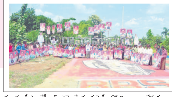
తల్లాడ : సీఎం కేసీఆర్, ఎమ్మెల్యే సంద్ర ఫెక్కిలతో నివాదాలు చేస్తున్న బీఆర్ఎస్ నాయకులు