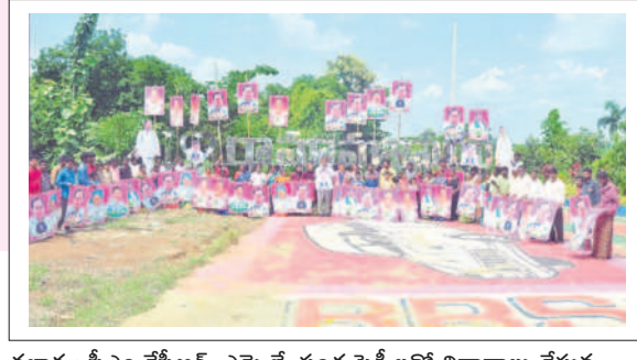
తల్లాడ : సీఎం కేసీఆర్, ఎమ్మెల్యే సంద్ర ఫెక్కిలతో నివాదాలు చేస్తున్న బీఆర్ఎస్ నాయకులు