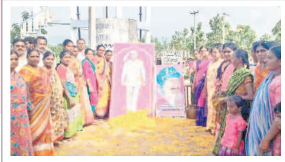
పెనుబల్లి : సీఎం కేసీఆర్ చిత్రపటానికి క్షీరాభిషేకం చేస్తున్న కార్యకర్తలు