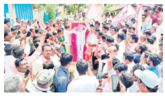
మధుర : సీఎం కేసీఆర్ చిత్రపటానికి క్షీరాభిషేకం చేస్తున్న వైద్యులు