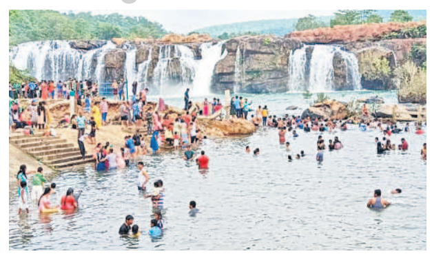
బొగత జలపాతం అందాలను వీక్షించి సెల్ఫీలు దిగుతున్న పర్యాటకులు, స్కిమ్మింగ్ ఫూల్ లో సందడి చేస్తూ..