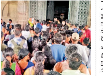
రామప్ప ఆలయంలో స్వామివారి దర్శనం కోసం బారులు తీరిన భక్తులు