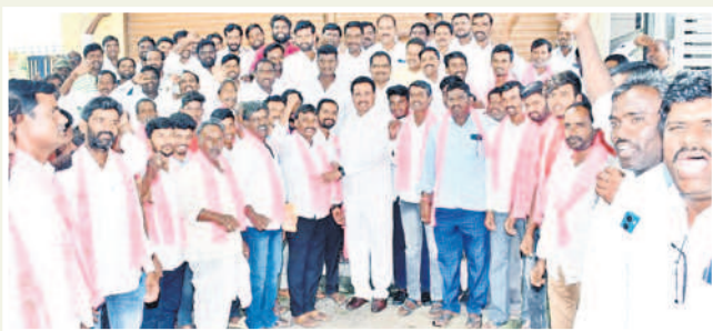
పార్టీలో చేరిన వారికి గులాబీ కండువలు కప్పతున్న విప్ గంప గోవర్ధన్