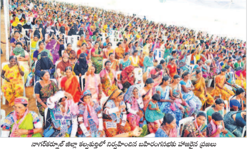
నాగర్ కర్నూల్ జిల్లా కల్వకుర్తిలో నిర్వహించిన బహిరంగ సభకు హాజరైన ప్రజలు

తెలంగాణకు ఏర్పడిన తరువాత రంగారెడ్డి జిల్లాలో భూములకు విలువ పెరిగిందని మంత్రి హామీకొర్రావు తెలిపారు. ఈ ప్రాంతానికి పరిశ్రమలు పెద్ద ఎత్తున తరలివస్తున్నాయని, దాదాపు 50 వేల మంది యువతకు ఉద్యోగాలు కల్పించేలా ఇండస్ట్రియల్ పార్కులను అభివృద్ధి చేస్తున్నామని చెప్పారు. రాష్ట్రంలో వ్యవసాయ రంగాన్ని, పరిశ్రమలను అభివృద్ధి చేస్తూనే సంక్షేమ పథకాలు అభివృద్ధి చేస్తున్నామని పేర్కొన్నారు. త్వరలోనే పాలమూరు రంగారెడ్డి ఎత్తిపోతల నీటిని మహేశ్వరం, కందుకూరు, ఇబ్రహీంపట్నం ప్రాంతాలకు పారింది ఈ ప్రాంత ప్రజల రుణం తీర్చుకుంటామని చెప్పారు. ఈ ప్రాంత అభివృద్ధి కోసం అపార్యులు కృషిచేస్తున్న సబ్సిడీ ఈసారి లక్ష పైచిలుకు మెజార్టీతో గెలవడం భాయమని పేర్కొన్నారు.