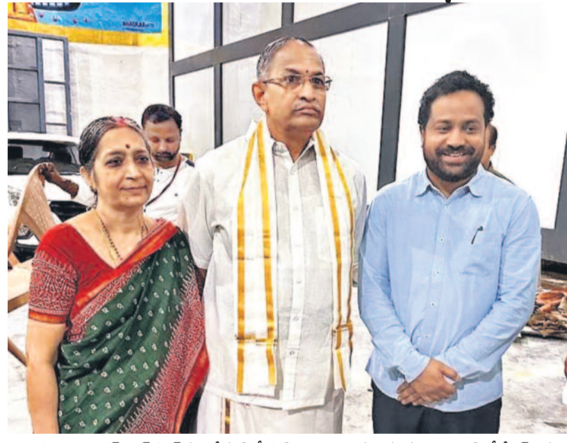
రంగనాయకసాగర్ పంపిణీని సమీక్షించే కాలిని సందర్శించిన ప్రవచనకర్త చాగంటి కోటేశ్వరరావు

చిన్నకోడూరు, అక్టోబర్ 1: ఎక్కడో దూరంలో ఉన్న కాశీశ్రీరం ప్రాజెక్టు నుంచి గోదావరి జలాలను ఇంత ఎత్తుపైకి తీసుకువచ్చి సిద్దిపేటలోని రంగనాయకసాగర్ ను నింపడం మామూలు విషయం కాదని, ఇదో అద్భుతమని ప్రముఖ ప్రవచనకర్త చాగంటి కోటేశ్వర రావు కొనియాడారు. ఆదివారం ఆయన సతీమణితో కలిసి రంగనాయకసాగర్ పంపిణీని సందర్శించారు. ఈ సందర్భంగా నీటిపారుదల శాఖ ఉప కల్యాణ కాశీశ్రీరం ప్రాజెక్టు విశేషాలను వారికి వివరించారు. ప్రాజెక్టు నిర్మాణ స్వరూపం, కాశీశ్రీరం నీళ్లు తీసుకొని ఎక్కడెక్కడికి పంపిస్తున్నారో వివరాలున్న మ్యాప్ ను సహాయంతో క్లుప్తంగా వివరించారు. ఈ సందర్భంగా చాగంటి కోటేశ్వరరావు మాట్లాడుతూ.. తాను ఇక్కడి వాతావరణం చూస్తుంటే ప్రకాశం బ్యారేజీ వద్ద ఉన్న అనుభూతి కలుగుతున్నదని అన్నారు. ఈ ప్రాజెక్టు నిర్మాణానికి మంత్రి హామీకొర్రావు కృషిని ప్రశంసించారు. కష్ట పడి పనిచేస్తే ఏదైనా సాధ్యమని కాశీశ్రీరం ప్రాజెక్టును చూస్తే అభ్రమవుతుందని, ఈ విషయాన్ని తన ప్రవచనాల్లో ప్రస్తావిస్తానని పేర్కొన్నారు.