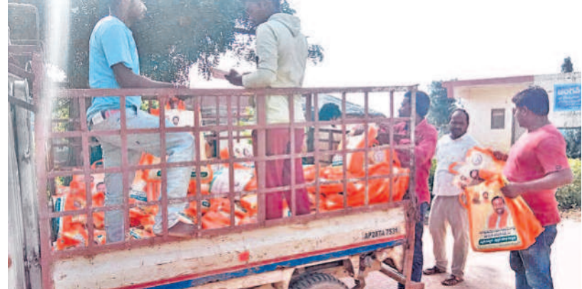
సిద్దిపేట జిల్లా దుబ్బాక నియోజకవర్గంలో ఎమ్మెల్యే రఘునందన్ రావు ఫోటోలతో పంపిణీ చేసిన చీరలు కిట్లు

దుబ్బాక టౌన్, అక్టోబర్ 1: సిద్దిపేట జిల్లా దుబ్బాక నియోజకవర్గంలో బీజేపీ డొడ్డి దారిని గెలువాలని ఎన్నికలకు ముందే ప్రజలను ప్రలోభాలకు గురిచేయడం ప్రారంభించింది. ఈ విషయమై కొన్ని దృశ్యాలు ఆదివారం సోషల్ మీడియాలో హాట్ టాప్ చేశాయి. ఎమ్మెల్యే రఘునందన్ రావు ఫోటోలు ఉన్న గొడుగులు, చీరలు, జ్యాబ్ బ్యాగులను బీజేపీ శ్రేణులు బహిరంగంగా గ్రామాల్లోకి అటోలో తీసుకొచ్చి పంపిణీ చేశాయి. బీజేపీ శ్రేణులు అందిస్తున్న జ్యాబ్ బ్యాగుల్లో చీరలు, గొడుగులు ఉన్నాయా? మరేమైనా డబ్బులు ఉన్నాయా? అంటూ కామెంట్స్ వస్తున్నాయని, బీజేపీ ఎమ్మెల్యే రఘునందన్ రావు సమాధానం చెప్పాలని బీఆర్ఎస్ శ్రేణులు సోషల్ మీడియా వేదికా దిశించారు.