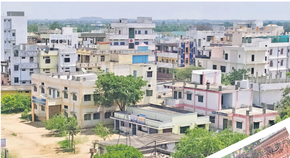
రామాయంపేట పట్టణం వూరూ