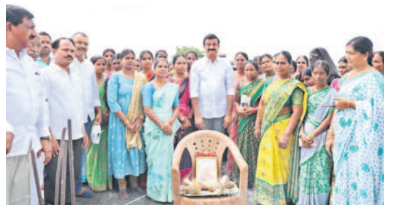
నార్సింగి మండల కేంద్రంలోని ఐకేపీ కార్యాలయం పైలంత్వ నిర్మాణానికి భూమి పూజ చేసిన మెదక్ ఎంపీ కొత్త ప్రభాకర్ రెడ్డి

రుణాలను సద్వినియోగం చేసుకుని ఆర్థికంగా ఎదగాలి పనిచేసే ప్రభుత్వానికి అండగా నిలబడాలి మెదక్ ఎంపీ కొత్త ప్రభాకర్ రెడ్డి నార్సింగిలో ఐకేపీ కార్యాలయం పైలంత్వ నిర్మాణానికి భూమిపూజ మహిళా సంఘాలతో సమావేశం