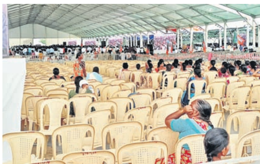
పాలమూరులో ప్రధాని మోదీ పర్యటన ఆంక్షల మధ్య సాగింది. అమిస్తాపూర్ వద్ద సభా వేదికగా రూ. 13,500 కోట్ల పనులకు శంకు స్థాపనలు, ప్రారంభోత్సవాలు చేసినా ఉమ్మడి జిల్లాకు మాత్రం మొండిచేయి చూపారని ప్రజలు అసహనం వ్యక్తం చేశారు. పాలమూరుకు జాతీయ హోదా మాట్ అత్రలేదని ఉసురు మన్నారు. సభకు జనాదరణ కర్చు చాలా వరకు ఖాళీ కుర్చీలే దర్శనమిచ్చాయి.

పద్నాలుగేండ్ల కిందట నది ఉద్ధతికి దెబ్బ తిన్న నాగల్ దిన్నె బ్రిడ్జి