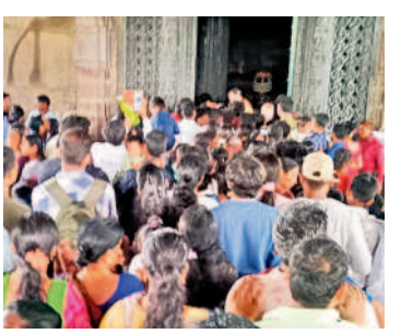
రామప్ప ఆలయంలో స్వామివారి దర్శనం కోసం బారులు తీరిన భక్తులు