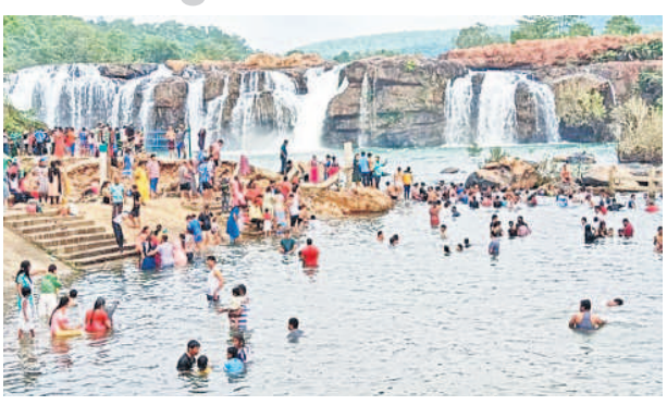
బొగత జలపాతం అందాలను వీక్షించి సెల్ఫీలు దిగుతున్న పర్యాటకులు, స్పీమ్మింగ్ ఫూల్ లో సందడి చేస్తూ..