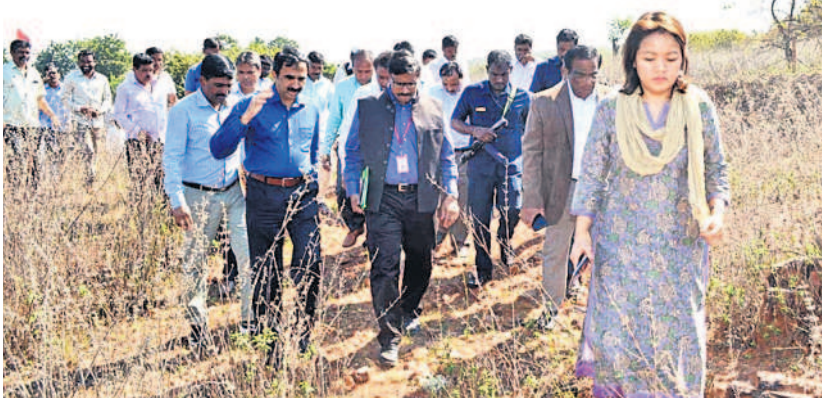
గిరిజన యూనివర్సిటీ కోసం 2018లో రాష్ట్ర ప్రభుత్వం కేటాయించిన భూమిని పరిశీలిస్తున్న కేంద్ర బృందంతో రాష్ట్ర అధికారులు

ములుగు, అక్టోబర్ 1 (నమస్తే తెలంగాణ) : దేశంలోనే ప్రతిష్టాత్మక గిరిజన యూనివర్సిటీకి ఎట్టకేలకు మోక్షం లభించింది. కేసీఆర్ సర్కారు పోరాట ఫలితంగా గిరిజనల కల సాకారమైంది. విభజన చట్టంలో పేర్కొన్న విధంగా ములుగులో ట్రైబల్ యూనివర్సిటీ ఏర్పాటు చేయాలని యాల్పి ఉన్నా పదేళ్లుగా కాలయాపన చేసిన మోడీ ప్రభుత్వం.. ఎన్నికల వేళ తప్పని పరిస్థితుల్లో ట్రైబల్ వర్మిటీపై ప్రకటన చేయాలని వచ్చింది. ఈమేరకు మహా బూజీనగర్లో ప్రధాని మోడీ ఈమేరకు ప్రకటన చేశారు. మేడారం వనదేవతలైన సమృద్ధి సారలమ్మ పేరిట యూనివర్సిటీ ఏర్పాటు చేయడంతో పాటు రూ.900 కోట్లు మంజూరు చేస్తున్నట్లు ప్రకటించారు. దీనిని ములుగు జిల్లాకేంద్రంలోని గట్టమ్మ దేవాలయ పరిసర ప్రాంతంలో ఏర్పాటు చేయనున్నది. ములుగు కేంద్రంగా ఏర్పాటుయ్యే యూనివర్సిటీ రాష్ట్రానికి తలమానికం కానున్నది.