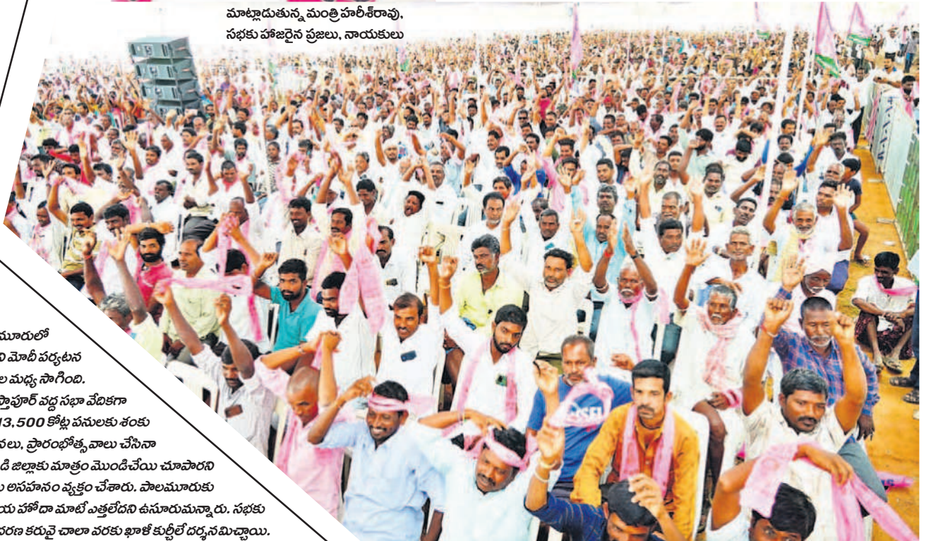
మాట్లాడుతున్న మంత్రి హరీశ్ రావు, సభకు హాజరైన ప్రజలు, నాయకులు

- నాగర్ కర్నూల్, అక్టోబర్ 1 (నమస్తే తెలంగాణ)