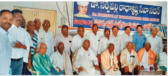
వృద్ధులకు సన్నానిస్తున్న విశ్రాంత ఉద్యోగస్తులు