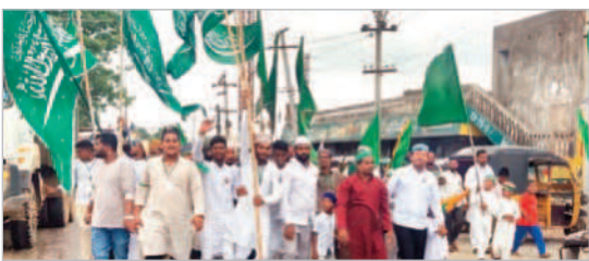
వట్టణంలో రియాలి నిర్వహిస్తున్న ముస్లిం మైనార్టీలు