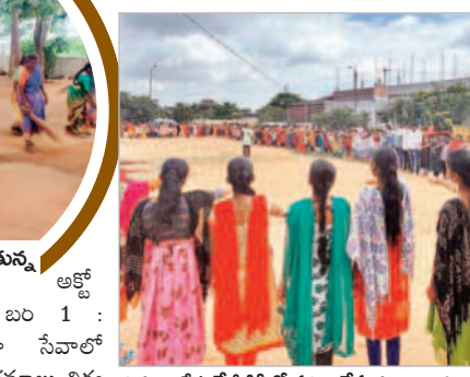
తిమ్మాజిపేట కేజీవీవీలో ప్రతిజ్ఞ చేస్తున్న విద్యార్థులు

మండలంలో స్వచ్ఛతాహీనవాలో భాగంగా పారిశుధ్య కార్యక్రమాల నిర్వహించారు. అక్టోబర్ 1 : మండలంలో స్వచ్ఛతాహీనవాలో భాగంగా పారిశుధ్య కార్యక్రమాల నిర్వహించారు. అక్టోబర్ 1 : మండలంలో స్వచ్ఛతాహీనవాలో భాగంగా పారిశుధ్య కార్యక్రమాల నిర్వహించారు.