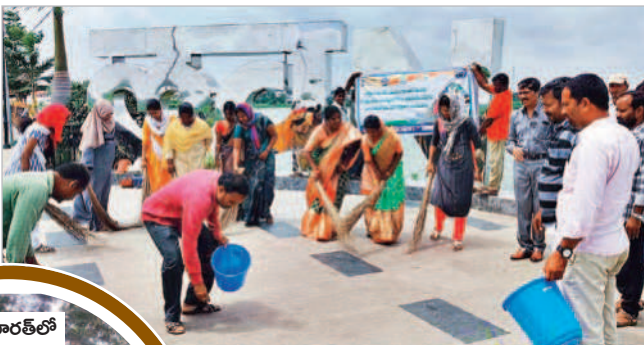
నాగర్ కర్నూల్ మినిట్యూంక్ బండ్లపై రోడ్లను శుభ్రం చేస్తున్న పుర చైర్పర్సన్, సిబ్బంది

తెలకపల్లిలో.. తెలకపల్లి, అక్టోబర్ 1 : మండలంలోని గౌరెడ్డిపల్లితో పాటు ఆయా గ్రామాల్లో ఆదివారం స్వచ్ఛతాహీనవా కార్యక్రమంలో భాగంగా శ్రమదానం నిర్వహించారు. గ్రామంలోని వీధులన్నీ ఊడ్చి అక్కడక్కడ పేరుకుపోయిన చెత్తను తొలగించారు. ఆయా గ్రామాల్లోని పంచాయతీ కార్యాలయాలు, ప్రభుత్వ కార్యాలయాల్లో స్వచ్ఛతాహీనవా కార్యక్రమాన్ని నిర్వహించారు.