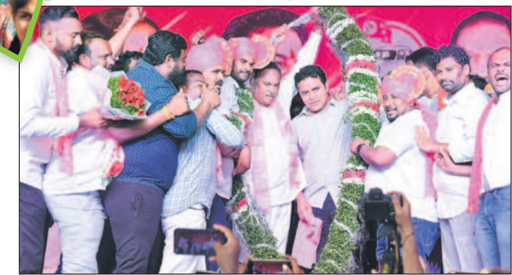
పెద్దపల్లిలో మంత్రి కేటీఆర్, ఎమ్మెల్యే దాసరిని సనాహరెడ్డి నాయకులు

కొంత మంది కాంగ్రెస్ కుకం కరెంట్ మీద అనుమానం ఉన్నది. 'కేసీఆర్ కరెంట్ ఎక్కడిప్పుడు? దమ్ముంటే చూపెట్టు' అని అంటున్నరు. 'ఒక వేళ ఇచ్చినట్లుంటే రాజీనామా చేస్తా' అని ఓ పెద్ద మనిషి కూడా అన్నడు. ఆ పెద్దమనిషికి, కాంగ్రెస్ నాయకులకు నేనొకటి చెబుతున్న పెద్దపల్లి నియోజకవర్గం, రాష్ట్రం ఉన్న మొత్తం కాంగ్రెస్ నాయకులందరూ రండి. మేమే బస్సులు పెడతాం. రేపంతోరెడ్డి కాన్పూరి ఇక్కడున్న విజయరమణారావు దాకా అందరికీ అందరూ రండి. పెద్దపల్లి ప ఊరో మీ ఇష్టం. ఏ టైమో మీ ఇష్టం. అందరూ వరుసల నిలబడి కరెంట్ తీగలను గట్టిగ పట్టుకోండి' అప్పుడు కరెంట్ ఉన్నదో..? లేదో తెలుస్తుంది. - మంత్రి కేటీఆర్