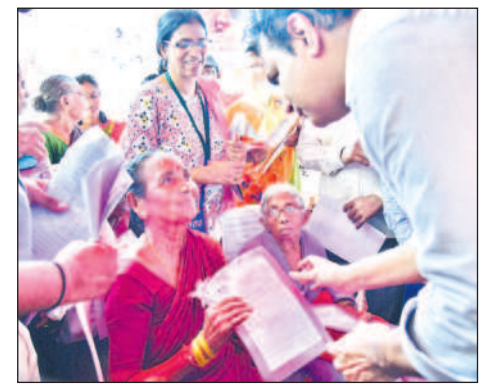
గోదావరిఖని: వృద్ధులారాటి పెంఘన్ ప్రాసీడింగ్ కాపీ అందజేస్తున్న మంత్రి కేటీఆర్, గౌరెల పంపిణీ చేస్తూ..