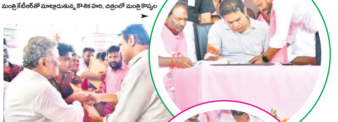
గోదావరిఖని: దశాబ్ది ప్రాసీడింగ్ అందజేస్తున్న మంత్రి కేటీఆర్