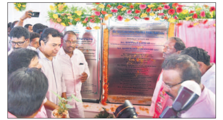
గోదావరిఖనిలో ఐటీ టవర్ నిర్మాణానికి శంకుస్థాపన చేస్తున్న మంత్రులు కేటీఆర్, కొప్పుల