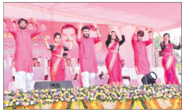
పెద్దపల్లి: కళాకారుల ఆటా పాట