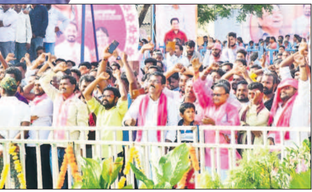
గోదావరిఖనిలో మంత్రి కేటీఆర్ కు చూసి ఆనందంతో జై కొడుతున్న ప్రజలు, నాయకులు