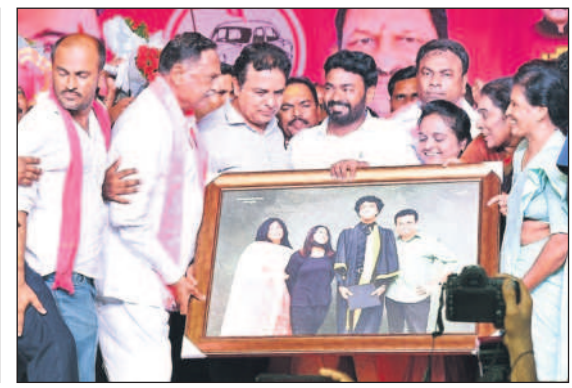
పెద్దపల్లిలో మంత్రి కేటీఆర్ కు ఫ్యామిలీ ఫోటోను అందిస్తున్న నాయకులు