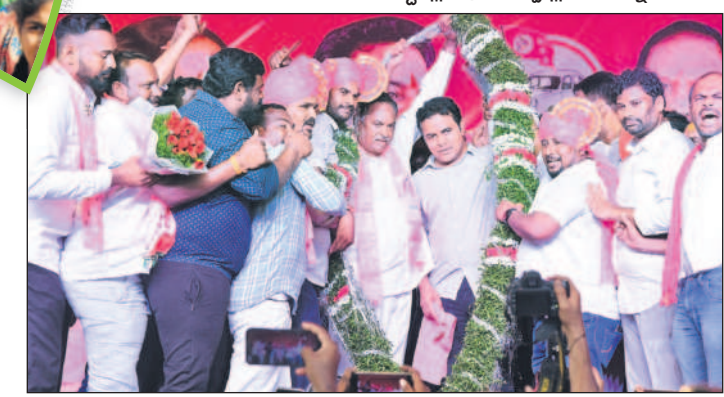
పెద్దపల్లిలో మంత్రి కేటీఆర్, ఎమ్మెల్యే దాసరిని జెమాలతో సన్మానిస్తున్న నాయకులు

కోత మంది కాంగ్రెస్ కు కరెంట్ మీద అనుమానం ఉన్నది. 'కేసీఆర్ కరెంట్ ఎక్కడిస్తుంది? దమ్ముంటే మాపట్టు' అని అంటున్నరు. 'ఒక వేళ ఇచ్చినట్లుంటే రాజీనామా చేస్తా' అని ఓ పెద్ద మనిషి కూడా అన్నడు. ఆ పెద్దమనిషికి, కాంగ్రెస్ నాయకులకు నేనొకటి చెబుతున్న పెద్దపల్లి నియోజకవర్గం, రాష్ట్రం ఉన్న మొత్తం కాంగ్రెస్ నాయకులందరూ రండి. మేమే బస్సులు పెడతాం. రేపంతోరెడ్డి కాన్పూరి ఇక్కడున్న విజయరమణారావు దాకా అందరికీ అందరూ రండి. పెద్దపల్లి ప ఊరో మీ ఇష్టం. ఏ టైమో మీ ఇష్టం. అందరూ వరుసల నిలబడి కరెంట్ తీగలను గట్టిగ పట్టుకోండి' అప్పుడు కరెంట్ ఉన్నదో..? లేదో తెలుస్తుంది. - మంత్రి కేటీఆర్