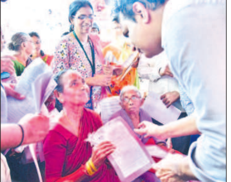
గోదావరిఖని: వృద్ధులారా కి పంపిన ప్రాసీడింగ్ కాపీ అందజేస్తున్న మంత్రి కేటీఆర్, గొర్రెలు పంపిణీ చేస్తున్నా..