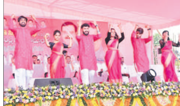
పెద్దపల్లి: కళాకారులు ఆటా పాటా