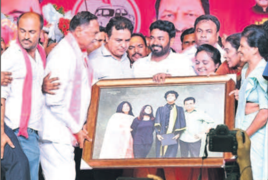
పెద్దపల్లిలో మంత్రి కేటీఆర్ కు ఫ్యామిలీ ఫోటోను అందిస్తున్న నాయకులు