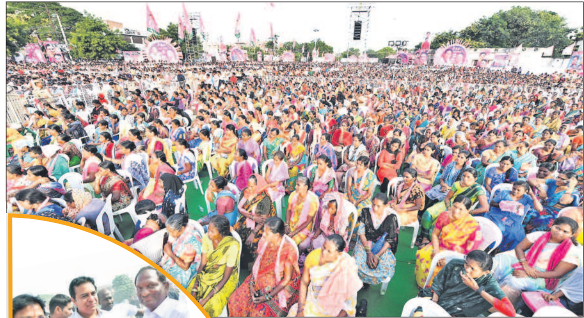
పెద్దపల్లి: ప్రభుత్వ జూనియర్ కళాశాల మైదానంలోని సభకు హాజరైన ప్రజలు