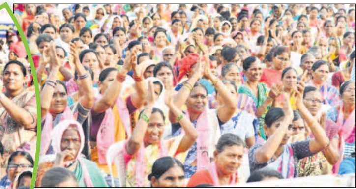
పెద్దపల్లి: సభలో చప్పట్లు కొడుతున్న మహిళలు

కోత మంది కాంగ్రెస్ కు కరెంట్ మీద అనుమానం ఉన్నది. 'కేసీఆర్ కరెంట్ ఎక్కడిస్తుంది? దమ్ముంటే మాపట్టు' అని అంటున్నరు. 'ఒక వేళ ఇచ్చినట్లుంటే రాజీనామా చేస్తా' అని ఓ పెద్ద మనిషి కూడా అన్నడు. ఆ పెద్దమనిషికి, కాంగ్రెస్ నాయకులకు నేనొకటి చెబుతున్న పెద్దపల్లి నియోజకవర్గం, రాష్ట్రం ఉన్న మొత్తం కాంగ్రెస్ నాయకులందరూ రండి. మేమే బస్సులు పెడతాం. రేపంతోరెడ్డి కాన్పూరి ఇక్కడున్న విజయరమణారావు దాకా అందరికీ అందరూ రండి. పెద్దపల్లి ప ఊరో మీ ఇష్టం. ఏ టైమో మీ ఇష్టం. అందరూ వరుసల నిలబడి కరెంట్ తీగలను గట్టిగ పట్టుకోండి' అప్పుడు కరెంట్ ఉన్నదో..? లేదో తెలుస్తుంది. - మంత్రి కేటీఆర్