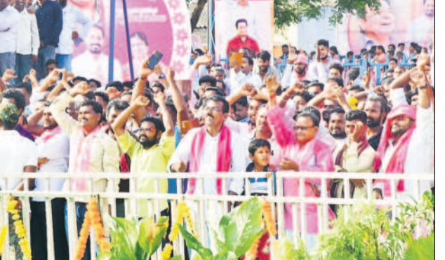
గోదావరిఖనిలో మంత్రి కేటీఆర్ కు చూసి ఆనందంతో జై కొడుతున్న ప్రజలు, నాయకులు