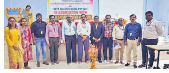
వర్క్ షాప్ ముగింపులో పాల్గొన్న అతిథులు, సిబ్బంది