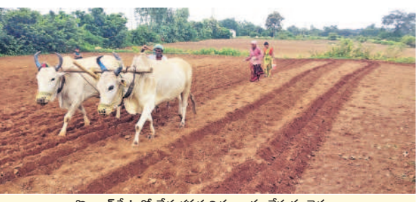
బొంరాస్ పేటలో వేరుశనగ చిత్తనాలను వేస్తున్న రైతులు