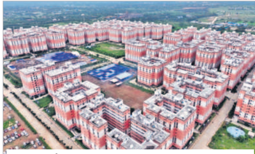
కొల్లూరులో నిర్మించిన డబుల్ బెడ్ రూం ఇండ్ల సమూహాలు