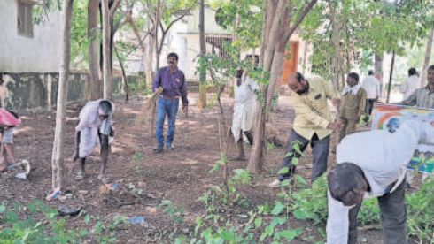
కల్లెర్ : శ్రమదానంలో చెత్తను తొలిగిస్తున్న ప్రజాప్రతినిధులు, అధికారులు