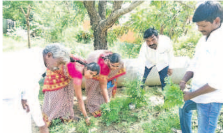
చౌటకూర్ : కోర్వోలులో స్వచ్ఛభారత్లో పాల్గొన్న సర్పంచ్, బీఆర్ఎస్ నాయకులు