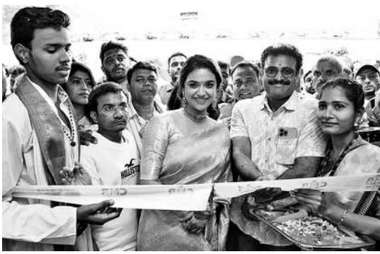
బాలాపూర్లో నూతనంగా ఏర్పాటు చేసిన సీఎంఆర్ షాపింగ్ మాల్ను ప్రారంభిస్తున్న సినీతార కీర్తి సురేశ్