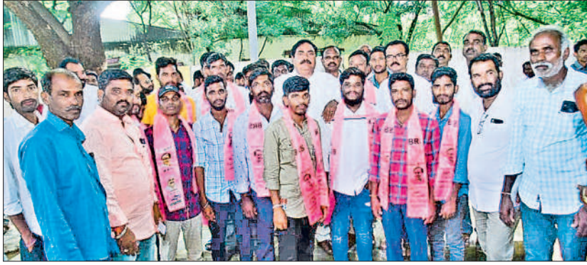
మంత్రి ఎర్రబెల్లి సమక్షంలో పార్టీలో చేరుతున్న కొలన్ పల్లి యువకులు

రాయపర్తి, అక్టోబర్ 1 : మండలంలోని గ్రామాలను రూ.కోట్లు ఖర్చు పెట్టి అభివృద్ధి చేసినట్లు రాష్ట్ర పంచాయతీరాజ్, గ్రామీణాభివృద్ధి శాఖామంత్రి ఎర్రబెల్లి దయాకర్ రావు తెలిపారు. ప్రతిపక్ష పార్టీల మాటలను ప్రజలు నమ్మవద్దన్నారు. హనుమకొండలోని ఆర్ అండ్ డిబీ గెస్ట్ హౌస్ లో మండలంలోని సన్నూరు గ్రామానికి చెందిన 30 మంది పలు పార్టీల కార్యకర్తలు, యువకులు ఆదివారం మంత్రి ఎర్రబెల్లి సమక్షంలో బీఆర్ఎస్ లో చేరారు. పార్టీలో చేరిన వారికి మంత్రి గులాబీ కండువలు కప్పి స్వాగతం పలికారు. ఈ సందర్భంగా మంత్రి ఎర్రబెల్లి మాట్లాడుతూ సన్నూరు గ్రామంలో వెలసిన శ్రీ వేంకటేశ్వరస్వామి ఆలయాన్ని గతంలో ఏ పాలకుడూ, ప్రభుత్వాలూ పట్టించుకోలేదన్నారు. ఆలయానికి సుమారు 650 ఎకరాల మార్వం భూములు స్వచ్ఛటికి ప్రభుత్వాలూ పట్టించుకోవడంతో అభివృద్ధికి ఆమడూరంలోనే నిలిచిపోయిందన్నారు. సన్నూరు గ్రామం అంటేనే రాయపర్తి మండలంలో ఓ మారుమూల ప్రాంతంగా మారిపోయిందని ఆవేదన వ్యక్తం చేశారు. ముఖ్యమంత్రి కేసీఆర్ హయాంలో బీఆర్ఎస్ ప్రభుత్వం ఉమ్మడి సన్నూరు గ్రామాన్ని సన్నూరు, వేంకటేశ్వరపల్లి, జయరాంతం(ఎస్), బాలనాయక్ తండా గ్రామ పంచాయతీలుగా మార్చడంతో గ్రామాలాభివృద్ధి వేగవంతంగా ముందుకు సాగు