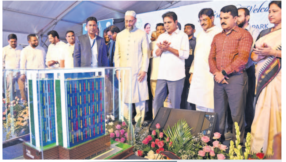
రూ.700 కోట్లతో మల్కేపేటలో 10.35 ఎకరాల్లో నిర్మించనున్న 21 అంతస్తుల ఐటీ టవర్ నమూనాను తిలకిస్తున్న మంత్రి కేటీఆర్, ఎంపీ అసదుద్దీన్ ఓజునీ